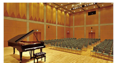
東京オペラシティ リサイタルホール

※両部門とも専門コースは、演奏の持ち時間10分以内、3,000円のチケットを一人20枚ご負担いただきます。愛好家コースは、演奏の持ち時間7分以内、3,000円のチケットを一人15枚ご負担いただきます。